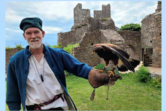
Traditionelles Jagdhandwerk: Auf der Burg Mont Orgueil in der Bucht von Grouville zeigt ein Falkner sein Können.