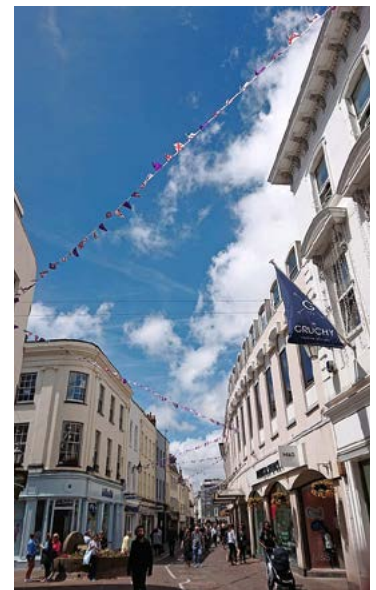
Belebt: die attraktive Fussgängerzone der Inselhauptstadt St. Helier.