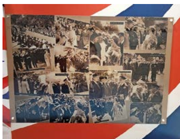
In den Jersey War Tunnels wird die Geschichte der Besatzung erklärt.