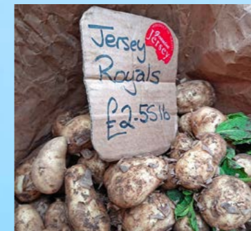
Hauptexportgut: Jersey Royals heissen die typischen Frühkartoffeln.