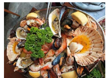
Wer Meeresfrüchte liebt, wird in Jersey auf seine Kosten kommen.