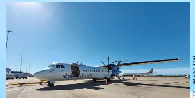
Propellermaschine: Vom 15. Mai bis 19. August 2023 werden Sonderflüge von Zürich nach Jersey mit Blueislands angeboten.