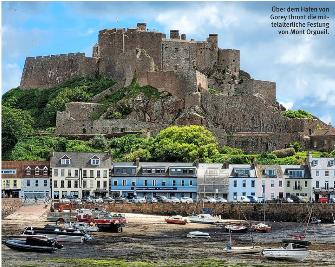
Über dem Hafen von Gorey thront die mittelalterliche Festung von Mont Orgueil.

KARTE: WWW.SEH-KARTE.DE; DIESE REISE WURDE UNTERSTÜTZT VON ROLF MEIER REISEN