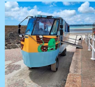
Ein Amphibienfahrzeug verbindet Elizabeth Castle mit dem Festland.