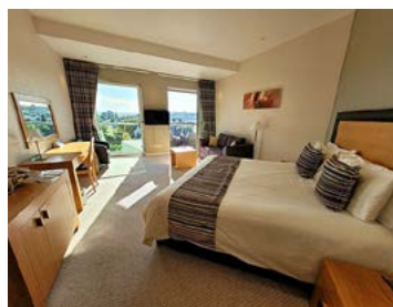
Chic: Zimmer mit Aussicht im Viersterne-Hotel de France in St. Helier.