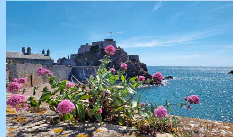
Majestätischer Anblick: In der malerischen Bucht von St. Aubin befindet sich – leicht erhöht auf einer Felsinsel – die 500-jährige Burg Elizabeth Castle.